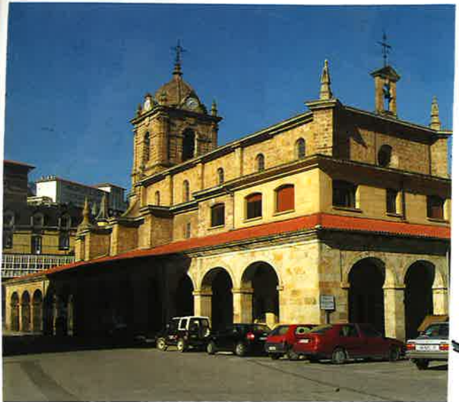
PARROQUIA DE N. SEÑORA DE LA ASCENSION

ORTEERA: 8'28 ~ TAN "TRENEZ" ~ LEGAZPI ~ ITZULERA: LEGAZPITIK 13'39 ETAN "TRENEZ"