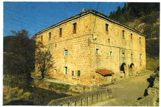
CASA TORRE DE ELORREGI