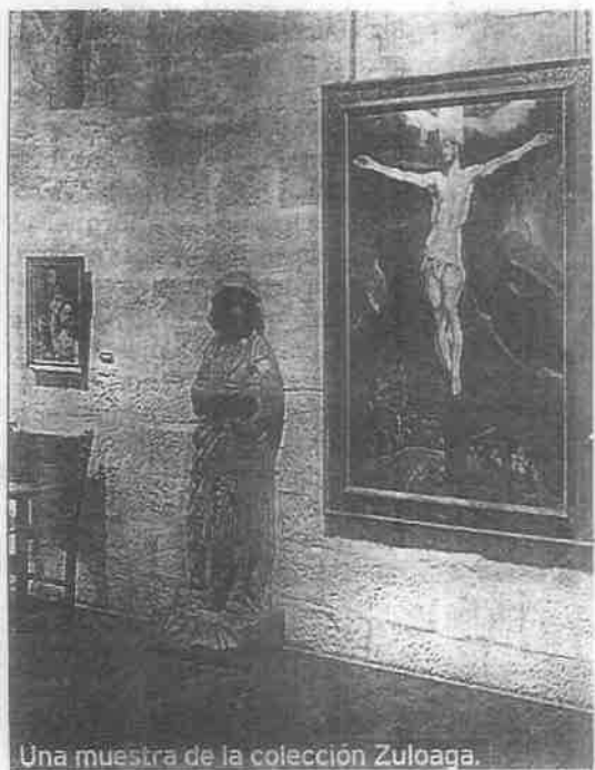
Una muestra de la colección Zuloaga.

MUSEO IGNACIO ZULOAGA - SANTIAGO ETXEA, 4. ☎ 943 862341. E-MAIL: MUSEOZUMAIA@IGNACIOZULOAGA.COM. - HORARIO DE MIÉRCOLES A DOMINGO, DE 16 A 20 h.