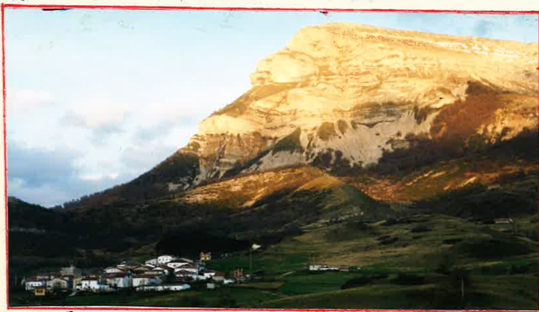
UNANUA Y SANDONATO.

EN LA PARTE ALTA DEL PUEBLO SE TOMA UN CAMINO MUY MARCADO, JUNTO A LA FUENTE. SIGUIENDO ÉSTE, PASAREMOS DELANTE DEL DEPÓSITO DE AGUAS PARA SUBIR, A CONTINUACIÓN, A UN ALTO. MÁS ADELANTE DEJAMOS UNA LANGA A LA DERECHA Y SEGUIMOS HASTA EL FONDO DE UN PEQUEÑO VALLE DEBAJO MISMO DE YURBAIN; DE ESTE PUNTO SEGUIMOS HACIA LA DERECHA, PARA, UNA VEZ ALCANZADA LA LOMA, IR A LA IZQUIERDA, SUBIENDO, A LA VEZ QUE NOS INTERNAMOS ENTRE LAS HAYAS. A CONTINUACIÓN, SALIMOS A LAS ROCAS Y, A MEDIA HORA, LLEGAMOS HASTA EL ALTO, DONDE HAY UN ÁRBOL. DESDE ESTE SOLITARIO PUNTO SUBIMOS EN ZIG-ZAG HASTA EL "MORRO" DE YURBAIN (1.420 m.). EXCELENTE MIRADOR DE LOS VALLES DE ARAKIL, BURUNDA Y ERGOYENA, ASÍ COMO DE LAS SIERRAS DE URBASA, ARALAR Y RESTO DE ANDIA.