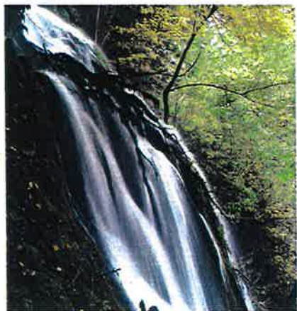
Nacadero del Urederra