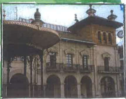
UDALETXEA - 159 m. SAN MARTIN PLAZA IRTEERA - HELMUGA

INFORMAZIOA ETA IZEN EMATEA: ASTELEHENETAN ETA ASTEAZKENETAN 19,30 ETATIK 21 ETARA