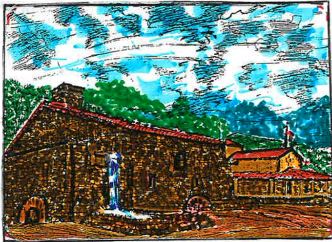
FERRERIA DE MIRANDAOLA

SALIDA 8,25' REGRESO 13,38' DESDE BEASAIN ~ ~ EN TRANVIA ~