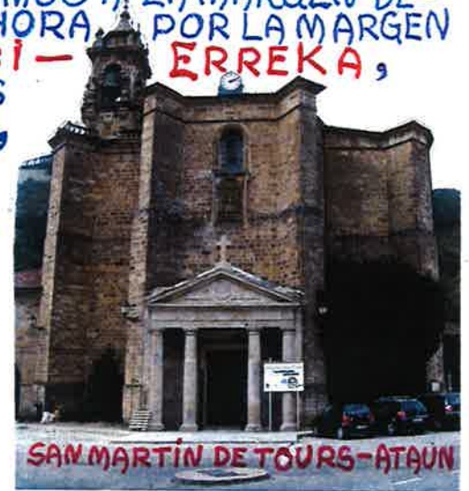
SAN MARTÍN DE TOURS - ATAÚN

T IEMPO APROXIMADO DE LA EXCURSIÓN ENTRE 3 Y 4 HORAS.