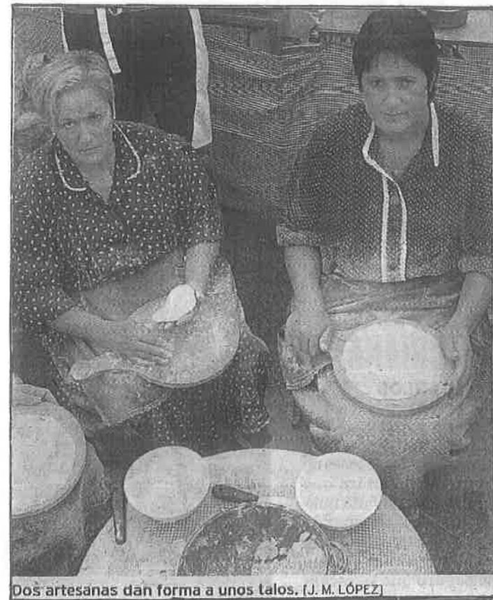
Dos artesanas dan forma a unos talos. (J. M. LÓPEZ)

DENTRO DE UN GRANDIOSO BOSQUE DE HAYAS CON SUS RAMAS ALZADAS HACIA EL CIELO FIJAN LA LLUVIA Y ALIMENTAN, GOTA A GOTA, LAS REGATAS, CUYAS AGUAS DARÁN DE BEBER A LOS DONOSTIARRAS. ARBOLES, MUCHOS DE ELLOS, TRASMUCHOS, AMPUTADOS EN SUS RAMAS, QUE NOS RECUERDAN EL TRABAJO MEDIEVAL DE LAS FERRERÍAS DE LA COLEGIATA.