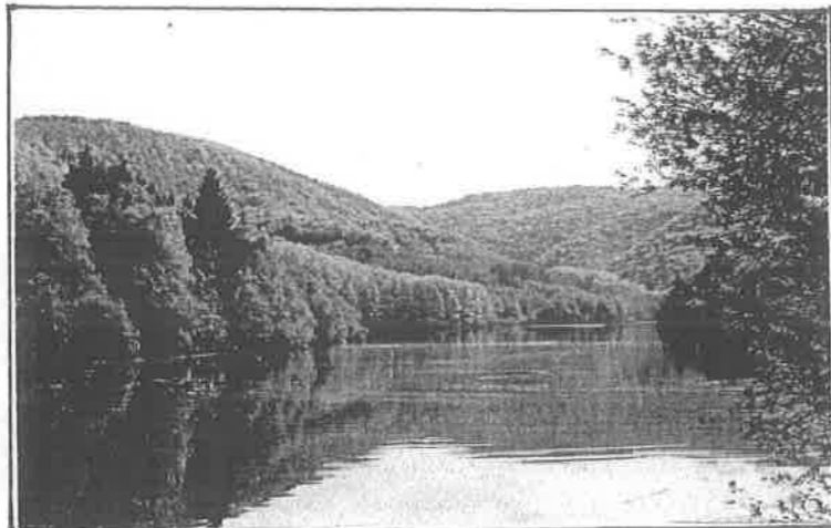
EMBALSE DE ARTIKUTZA