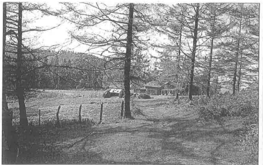
La casa del guarda de Artikutza en un claro del arbolado

COLEGIATA: UN BÁCULO, UNA CRUZ Y UNA ESPADA REUNIDAS EN UN SOLO OBJETO.