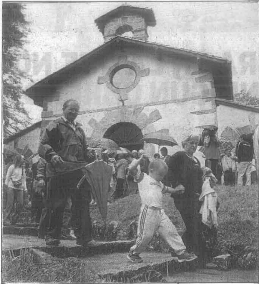
ERMITA DE SAN AGUSTÍN

CON UNA MISA EN LA ERMITA DEL SANTO SUELEN COMENZAR, LAS ACTIVIDADES FESTIVAS QUE SE EXTIENDEN A LO LARGO DE TODA LA JORNADA. PARTIDOS DE PELOTA, BERTSOLARIS, EXHIBICIONES DE DEPORTE RURAL Y MÚSICA, INCLUSO BAILABLES HASTA LA MADRUGADA, COMPONEN EL PROGRAMA DE UNA JORNADA QUE, POR UN DÍA, LLENA DE ANIMACIÓN Y GENTE EL POR LO GENERAL TRANQUILO POBLADO DE ARTIKUTZA.