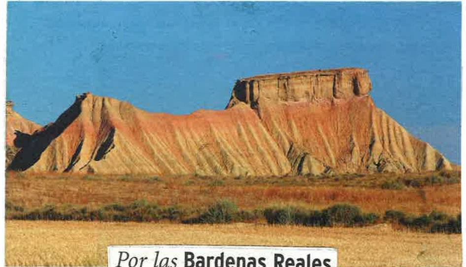
Por las Bardenas Reales

COMENZAREMOS LA ASCENSIÓN, PASAN- DO POR EL CASTILLO DE PEÑAFLOR Y PUNTA DE LA ESTROZA. 12h. UNA VEZ VISITADO ESTE LUGAR INI- CIAMOS EL DESCENSO HASTA LA CABAÑA DE MIKELEZ, DONDE DAREMOS CUENTA DE UNA COMIDA TÍPICA DE ES- TA ZONA ~ SOBRE LAS ~ 13'30 HORAS.